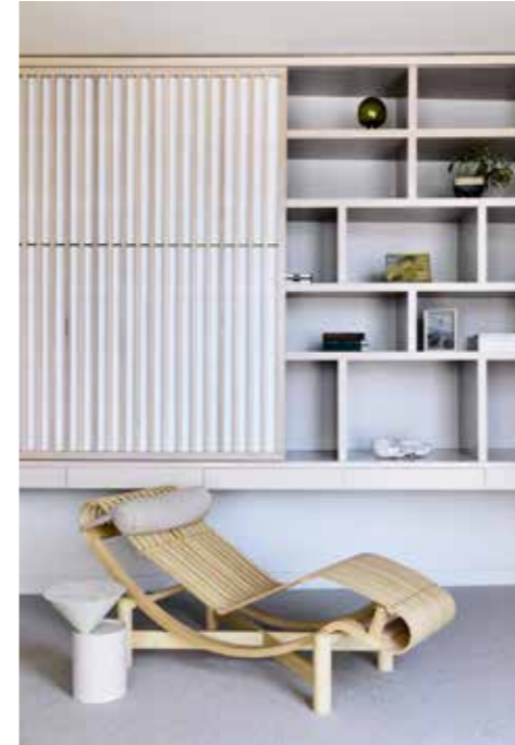
Links Tokyo Chaise Longue van Charlotte Perriand voor Cassina, bijzettafeltje Laurel van Luca Nichetto voor De La Espada, kast ontworpen door Kennedy Nolan en gemaakt door Overend Constructions