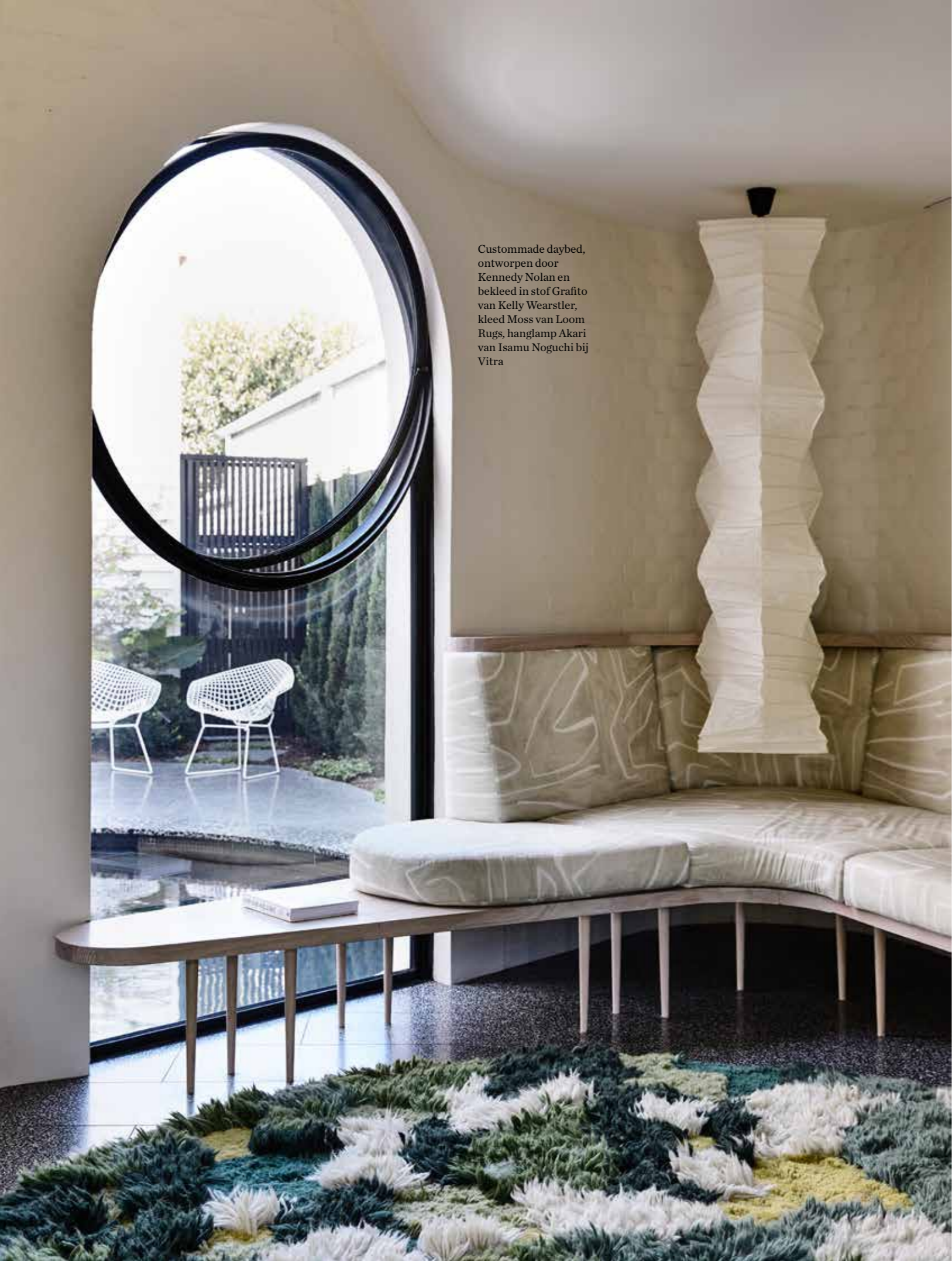
Custommade daybed, ontworpen door Kennedy Nolan en bekleed in stof Grafito van Kelly Wearstler, kleed Moss van Loom Rugs, hanglamp Akari van Isamu Noguchi bij Vitra